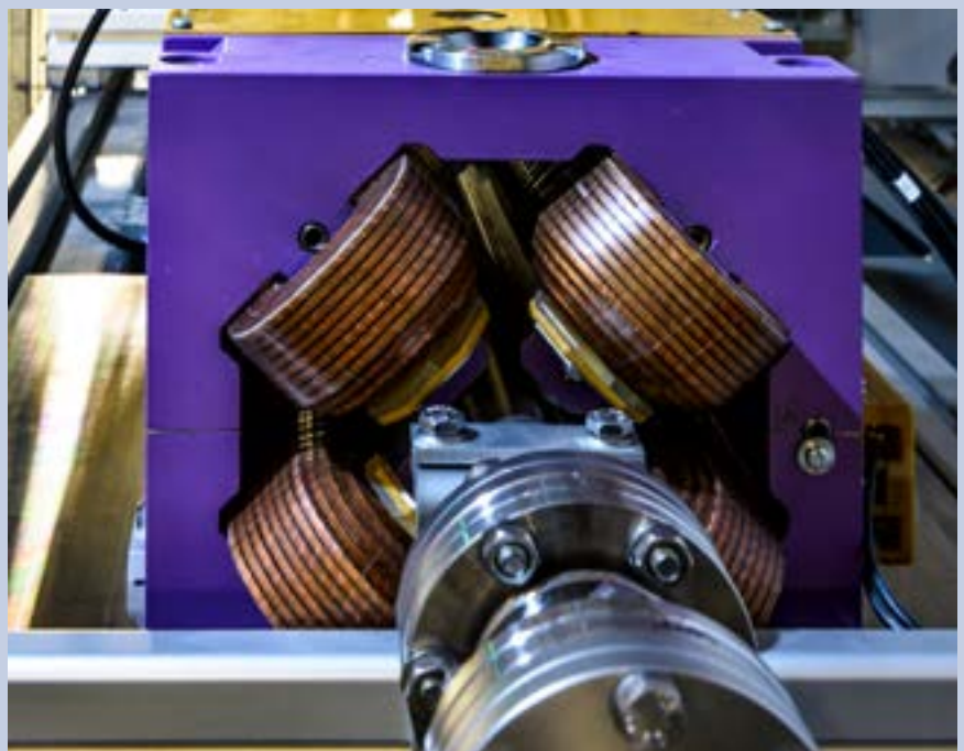
Linjäraccelerator magnet vid MAX IV-laboratoriet.

En framgångsrik samverkan ska ge alla inblandade aktörer ett mervärde. Historiskt sett har en mängd innovationer med civila tillämpningar kommit ur civil-militär samverkan och regeringens försvarsinnovationsinitiativ har som mål att höja försvarsförmågan och samtidigt bidra till ökad konkurrenskraft.