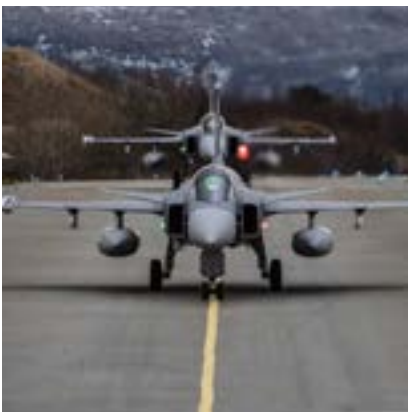
JAS 39 Gripen taxar ut på flygplats.

Detta förutsätter bland annat en utvecklad upphandlingsprocess utformad för att inhämta kunskap och omhändertaga relevant teknisk utveckling genom dialog med leverantörsmarknaden. Här bör alla de upphandlingsförfaranden som står till buds beaktas, kopplat till de förmågebehov som identifierats i syfte att efterfråga innovationer där lösningar behöver vidareutvecklas eller rent av saknas.