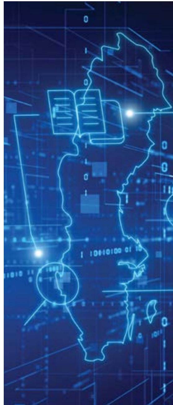
Illustration: Cybercampus Sverige

I budgetpropositionen för 2024 föreslog regeringen flera olika satsningar på utbildning och forskning som ska stärka ingenjörsländet Sverige och möta de stora kompetensbehoven. Bland annat föreslogs en utbyggnad av civilingenjörsutbildningarna och en höjning av ersättningsbeloppen för utbildningar inom naturvetenskap och teknik. Kvalitetssatsningen omfattar 100 mnkr 2024, 200 mnkr 2025 och 305 mnkr 2026.